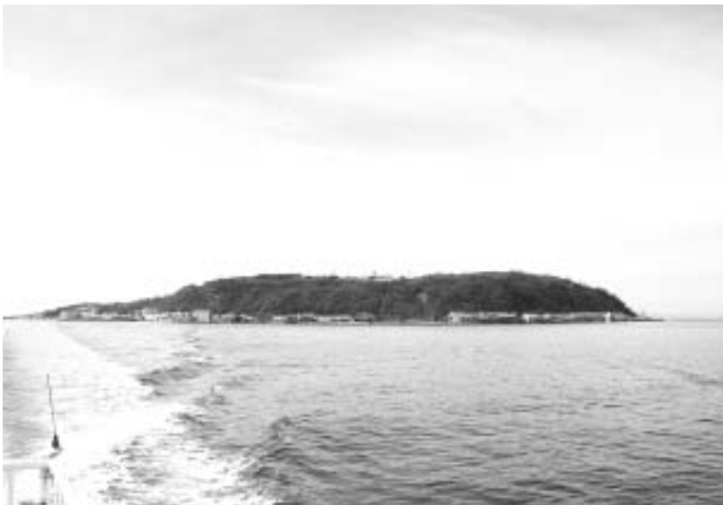
ニュー伊吹丸から見た「伊吹島」