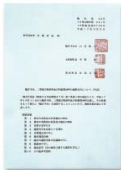
廃置分合(合併)申請書