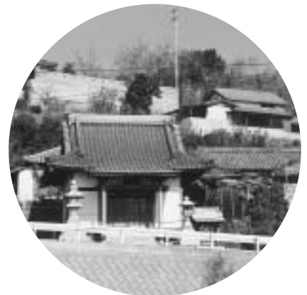
木彫りの神様「よべっさん」がお祀りされています。