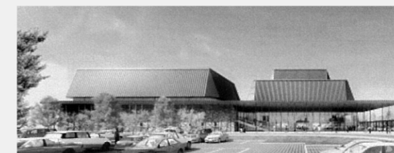
新市民会館完成予想図