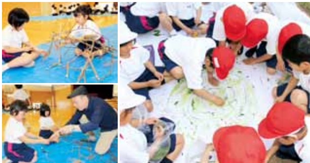
かがわ・山なみ芸術祭(5月15日～29日に五郷地区で開催)に完成した作品を出品！

自由な発想と感性豊かな心を育てるため、平成28年度1回目の「観音寺子どもの夢事業」が観音寺小学校で開催されました。大学教授や染色アーティストを招き、1年生は草花などを使った緑画制作、2年生は小枝と輪ゴムを使ってのオブジェ作り、3年生は染色活動と、生き生きとした表情の子どもたち。友だちと相談しながら、個性豊かな作品が完成しました。