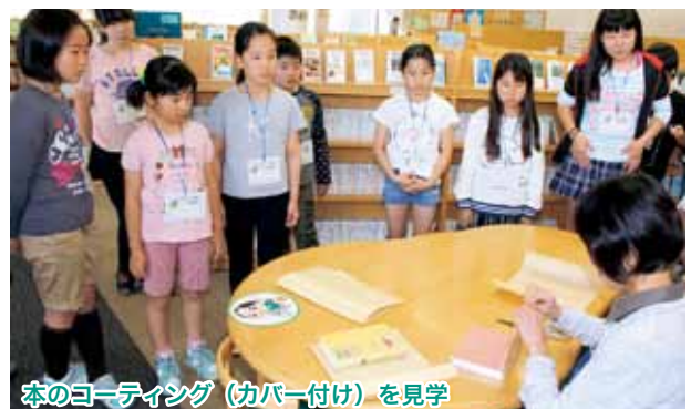
本のコーディネート（カバー付け）を見学

こどもの読書週間（4月23日～5月12日）に合わせ行われる図書館行事「キッズ図書館員になろう！」が中央図書館であり、小学生26人が図書館員を体験。普段入ることのできない書庫やカウンターでの本の貸し出しや返却、図書館にまつわるクイズに答え、スタンプを集めるスタンプラリーなどを通して、本や図書館に親しみや興味を示していました。