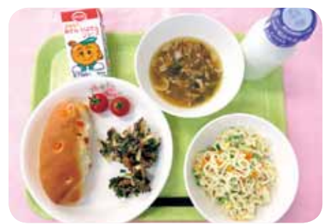
〈献立〉観音寺学校給食センター