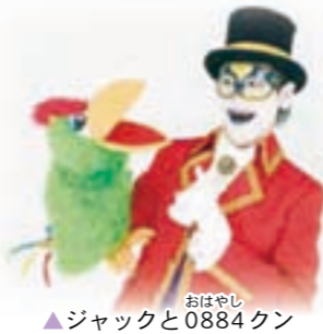
▲ジャックとおはやし 0884クン