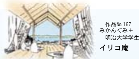
作品No.167 みかんぐみ+ 明治大学学生 イリコ庵