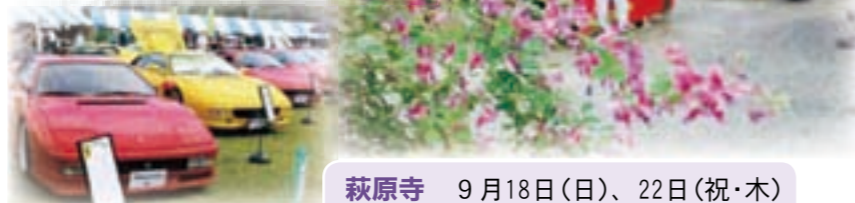
▲スーパーカーや ヴィンテージカーの展示