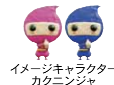
イメージキャラクター カクニンジャ