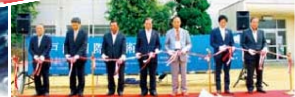
元気いっぱいの歌声で盛り上げました オープニングセレモニー