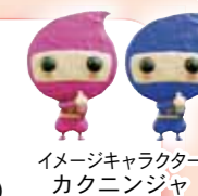
イメージキャラクター カクニンジャ