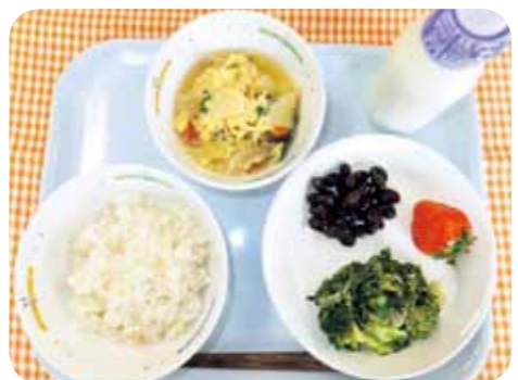
〈献立〉大野原学校給食センター ★他人丼 ★黒豆の甘煮 ★サニーレタスとブロッコリーのあえ物 ★イチゴ(さぬきひめ) ★牛乳

全国学校給食週間には、郷土料理や地場産物を活用した料理を学校給食に取り入れて、子どもたちに地域の食文化や産業、自然環境などについて理解を深め、郷土に関心を寄せる心や感謝する心を育みます。 今月は、地元野菜のサニーレタスとブロッコリーを使ったあえ物を紹介します。レタス類は、サラダやつけ合わせなど生でおいしく食べられる野菜ですが、学校給食では加熱調理します。サニーレタスは、ゆでると赤紫色が驚くほど鮮やかな緑色になります。また、ゆでてもシャキッとした食感でおいしいと好評です。新鮮な地元野菜をいろいろな料理で、おいしくいただきます。