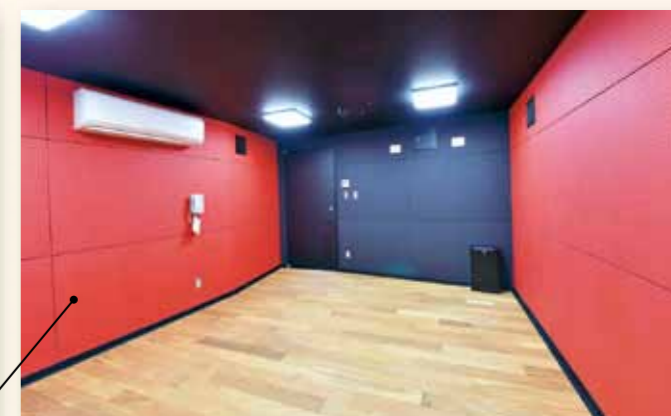
練習室 A 少人数のミーティングにも最適！