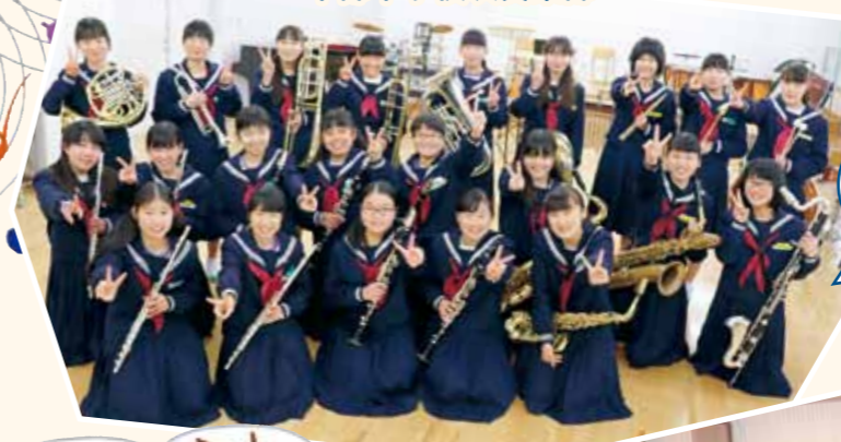
中部中学校吹奏楽部