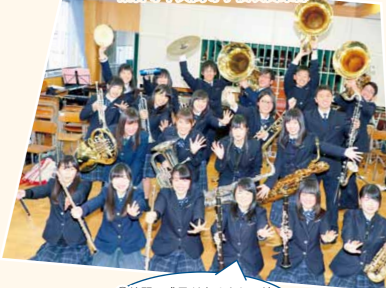
観音寺中央高等学校吹奏楽部