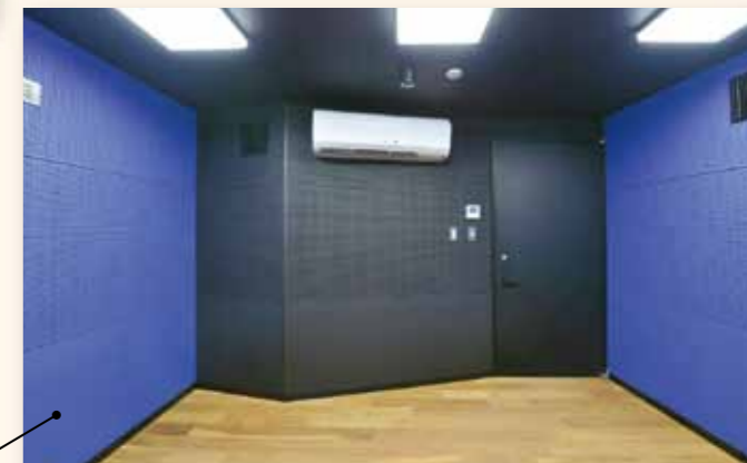
スタジオ A 完全防音で、録音もできます。