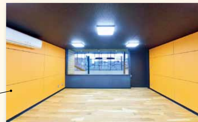
練習室 B 歌や楽器の練習に！