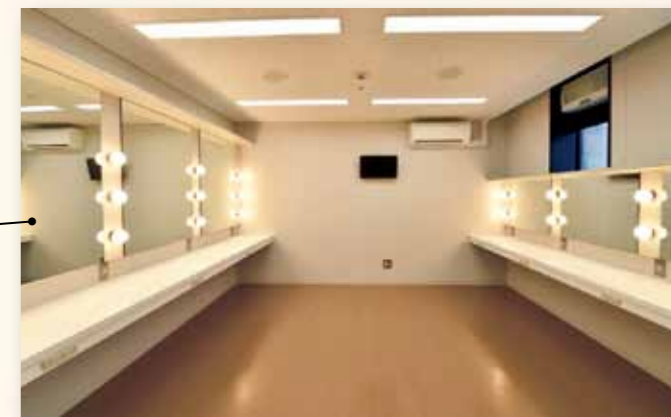
大楽屋 舞台への導線もスムーズです。