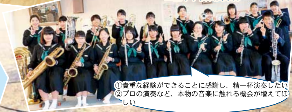
三豊中学校吹奏楽部