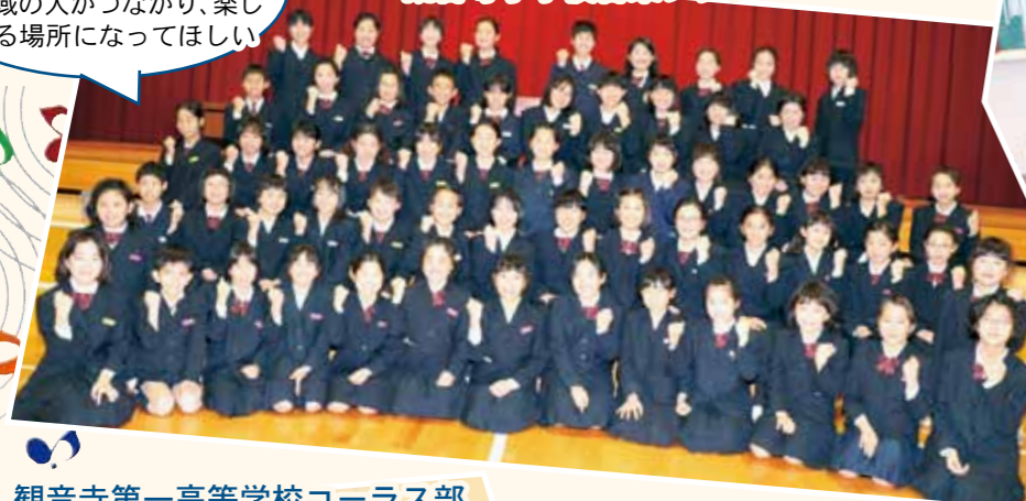
観音寺第一高等学校コーラス部