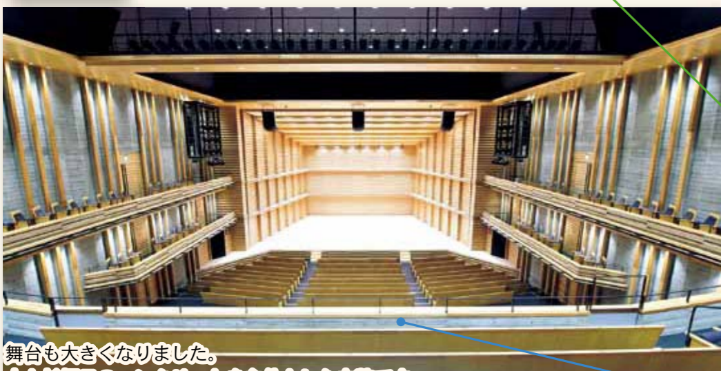
舞台も大きくなりました。木と杉板目のコンクリートを主体とした内装です。