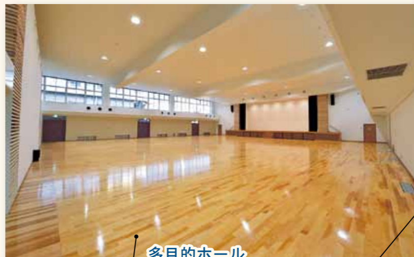
多目的ホール 旧観音寺南小学校の体育館をリニューアル しました。 展示・販売や各種大会にも利用できます。