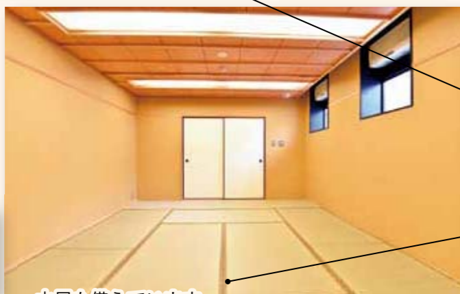
和室 Japanese Room