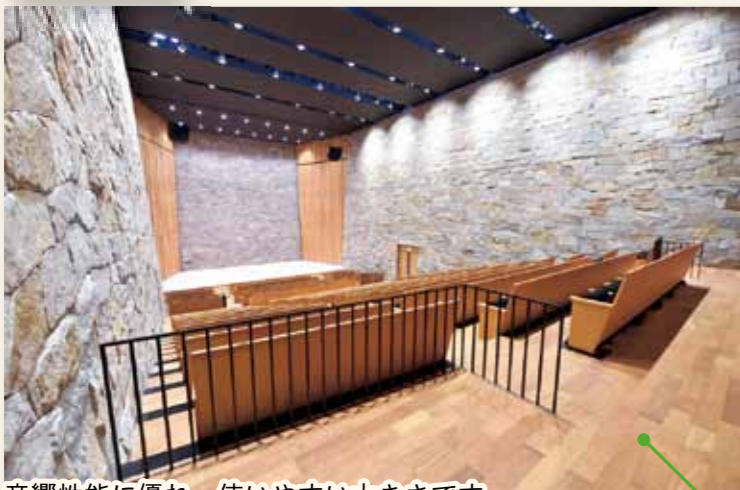
音響性能に優れ、使いやすい大きさです。