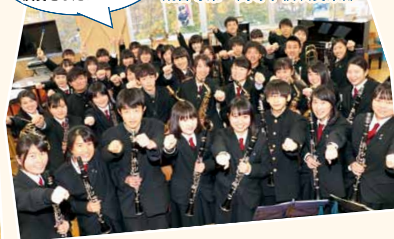
観音寺第一高等学校吹奏楽部