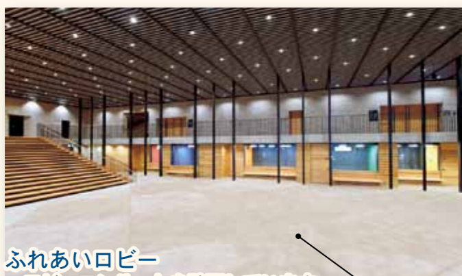
ふれあいロビー ロビーコンサートを計画しています。