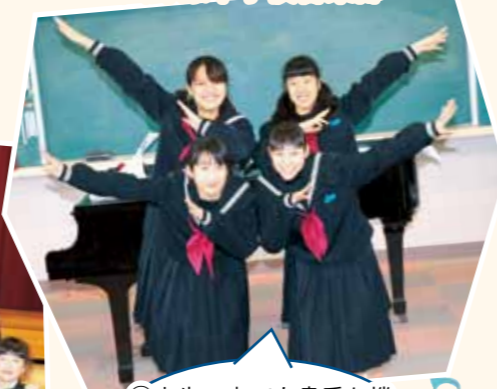
大野原中学校音楽部