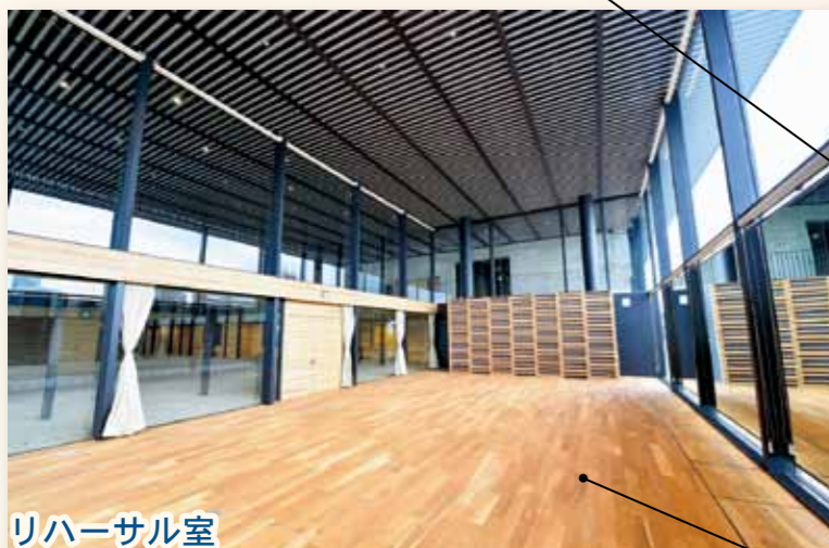
リハーサル室 ダンスの練習や舞台稽古など さまざまな用途に使えます。