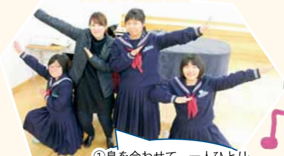
中部中学校合唱部