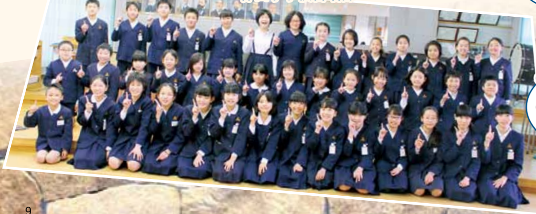
柞田小学校合唱部