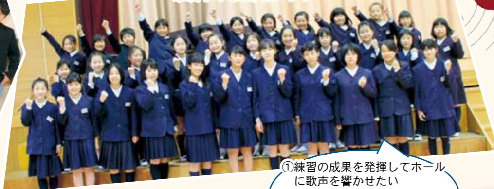
常磐小学校合唱クラブ