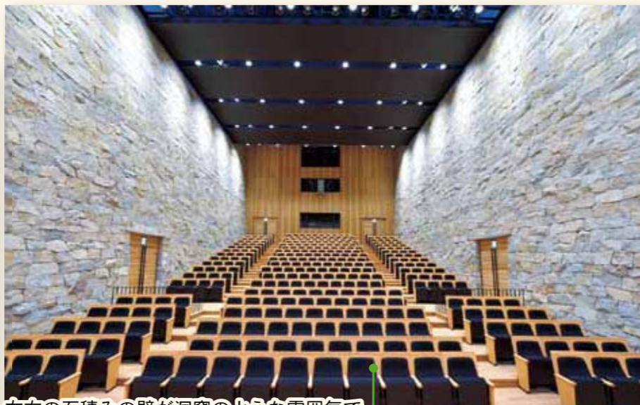
左右の石積みの壁が洞窟のような雰囲気、他に類を見ない内装です。