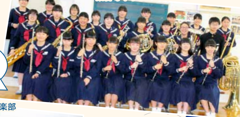
観音寺中学校吹奏楽部