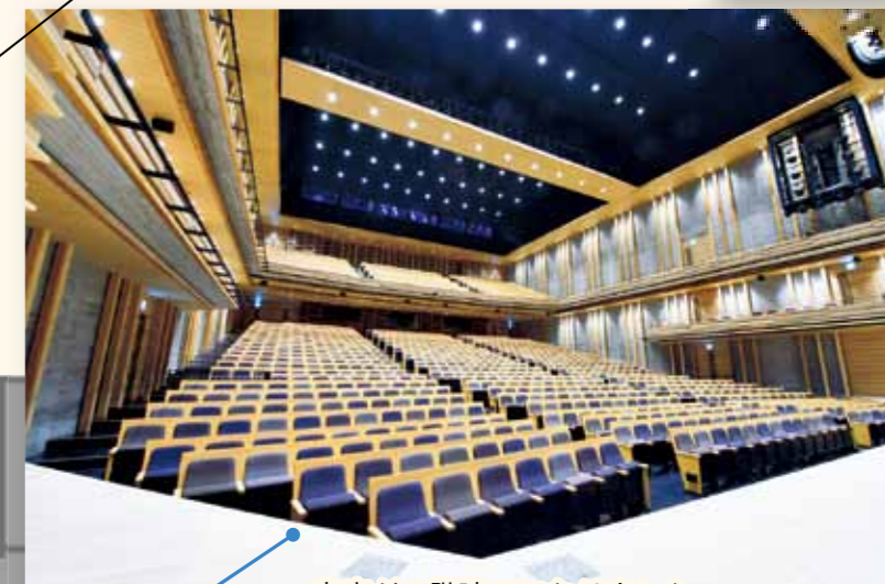
客席が2階建てになりました。迫力の舞台を間近で見ることができます！