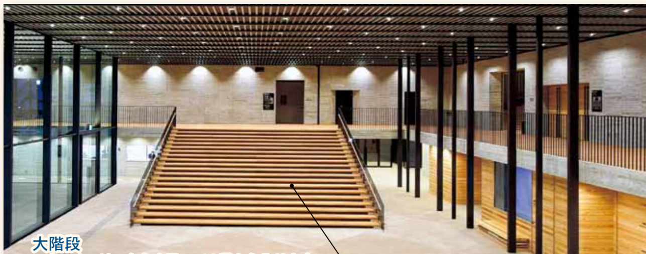
大階段 ホールへはこちらを通過して2階から入ります。