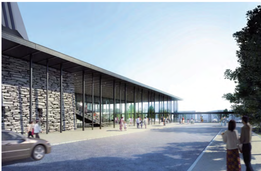
賑わいと回遊性を高める安心・安全で快適なアプローチ

具体的な事業内容については、観音寺市民会館開館準備実行委員会（仮称）を平成26年度に設置し、検討していきます。