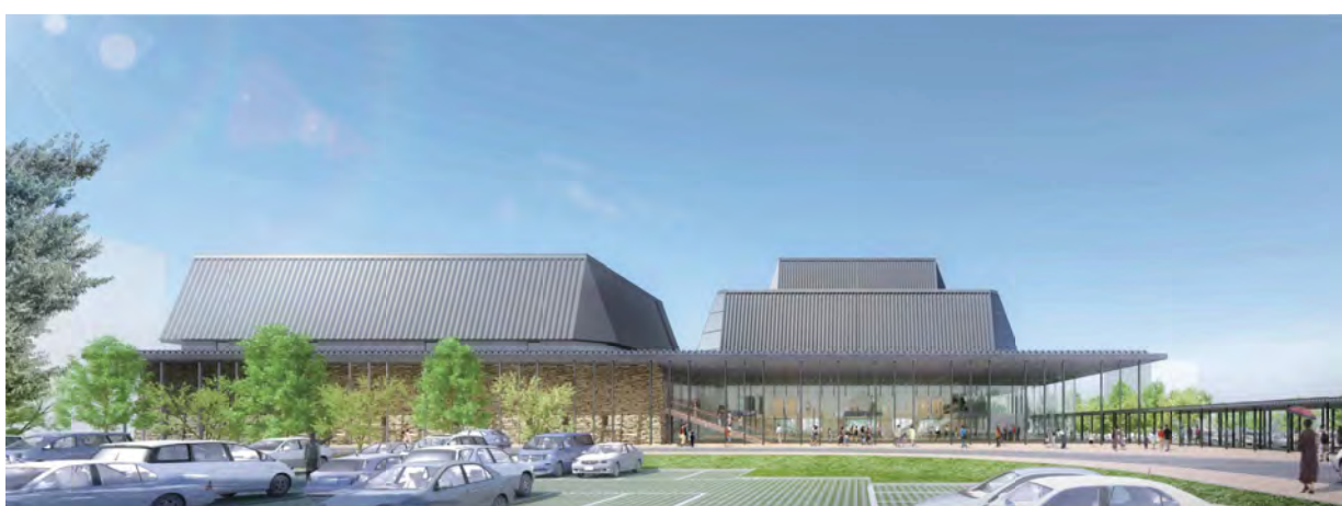
新市民会館完成予想図

なお、この管理運営計画は、市内の文化、芸術又は市民会館整備に関して高い識見を持っている人など11名で組織する「観音寺市民会館管理運営検討委員会」で出された意見を踏まえながら策定しています。