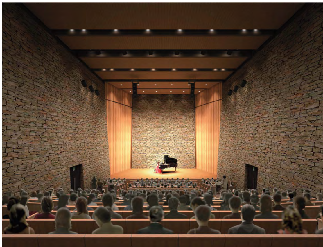
室内楽にふさわしい豊かな響きと親密さを持つ「小ホール」

新市民会館には、市民と会館（市）をつなぐ人材を配置し、ホール職員が中心となり、市民から事業企画を募ったり、ネットワークづくりでは市内で活動している個人や団体同士が情報を共有できるような合議体を定期的に設けたりするなど、市民が文化芸術活動に関わっていくためのきっかけづくりや新市民会館への関心を喚起するような機会を設け、将来的に市民の活動が活性化していくことをめざしていきます。