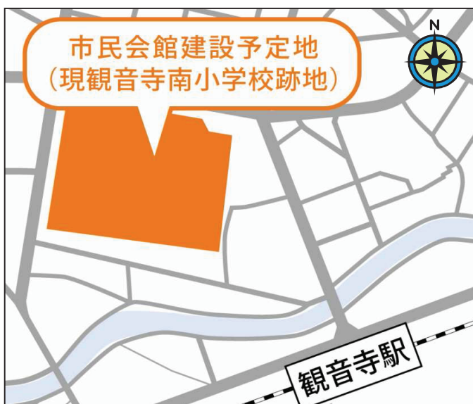
観音寺市観音寺町甲1186番地2

約2万4千㎡の敷地面積を活かし、駐車スペースや外構緑地を整備することにより、市民に憩いの場を提供することができ、また、交流人口の増大と市街地の活性化が期待できる場として現観音寺市立観音寺南小学校跡地を建設予定地とする提案を市議会公共施設等整備調査特別委員会に提出し、2月に承認を得ました。