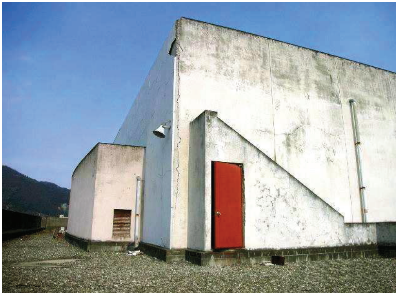
大ホール屋上西側扉付近、外壁剥離が生じ、南側壁にもクラックが生じている様子