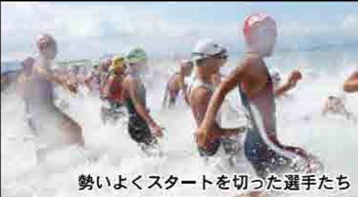
勢いよくスタートを切った選手たち