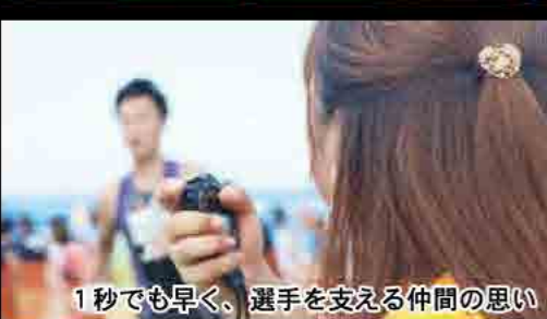
1秒でも早く、選手を支える仲間の思い