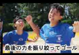
最後の力を振り絞ってゴール