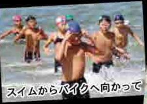
スイムからバイクへ向かって