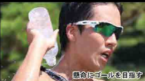
懸命にゴールを目指す