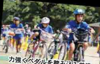
力強くペダルを踏み込み前進