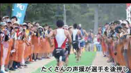
たくさんの声援が選手を後押し