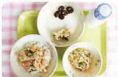
〈献立〉豊浜小学校 ★親子どんぶり★昆布の天ぷら★牛乳★モヤシの甘酢あえ★しょうゆ豆

学校給食 食育コーナー 6月は「食育月間」毎月19日は「食育の日」です! 「食育」とは、食に関する知識と食を選択する力を習得し、健全な食生活を送ることができる人を育てることです。「飽食の時代」ともいわれている現在、食を大切にする意識が薄れ、栄養の偏りや不規則な食事、生活習慣病の増加、過度の痩身志向、食の安全など、さまざまな問題が生じています。そのような中で、生涯にわたって心も体も健康に過ごすためには、子どものころからの食育がとて大切で、学校では、給食の時間はもちろん、各教科においても発達段階に応じて食育を進めています。家庭での「食育の取り組み」の例を紹介し、この機会に家庭でも、できそうなことから取り組んでみてはいかがでしょうか? ・「早寝・早起き・朝ごはん」の生活リズムを整えよう。 ・家族で食卓を囲みましょう。 ・地域に伝わる郷土料理や行事食を取り入れよう。 ・家族と一緒に食事の支度をしましょう。 ・家庭菜園や農作業を体験する機会をもちましょう。 モヤシの甘酢あえ (材料 4人分) モヤシ250g、キュウリ70g、ニンジン25g、ちりめんじゃこ10g、ごま小さじ2、調味料(酢大さじ1、砂糖大さじ1、しょうゆ小さじ2) 作り方 ①キュウリは小口切り、ニンジンはせん切りにし、モヤシは適当な長さに切る。 ②鍋にたっぷりのお湯を沸かし、時間差をつけてニンジン、モヤシ、キュウリの順に入れてゆでる。 ③ゆでた野菜は手早く水で冷やし、水気をしぼる。 ④ボウルに調味料を混ぜ合わせ、ゆでた野菜とちりめんじゃこ、ごまを加えてあえる。