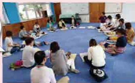
タッチケア&わらべうた