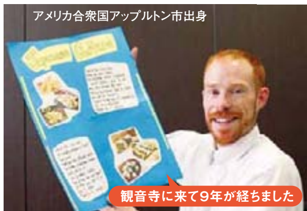
アメリカ合衆国アップルトン市出身

英語で観音寺市についてのポスター制作や市内在住の外国人にクリスマスカードや年賀状を出すなどの取り組みをしています。これは、生徒に観音寺市の良さを発見、再確認してもらいたい、異文化に触れてもらいたいという願いがあ