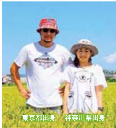
東京都出身 神奈川県出身

農業法人が多く、受け入れ体制が整っている香川県。移住のきっかけは、本市の農業法人のボランティアバイトに2カ月間参加したことです。そのまま2年半同法人で研修し、平成25年6月に専業農家として独立、現在はレタスや米、ネギを栽培しています。また、住まいは本市の空き家バンク制度を利用して入居を決めたIターンのお二人です。