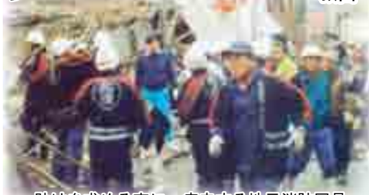
助けを求める声に、疾走する地元消防団員

阪神淡路大震災の震源地、淡路島の北淡町では地域の情報共有や消防団との協力によって約300人を倒壊家屋から助け出し、生き埋めのまま犠牲になった人は1人もいませんでした。