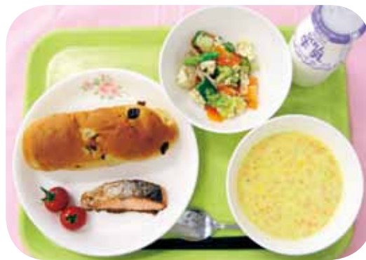
献立 (大野原学校給食センター) ★レーズンパン ★サケの塩焼き ★豆腐サラダ ★ニンジンのミルクスープ ★牛乳 ★ミニトマト

子どもには水筒にお茶を持たせ、朝食には野菜のおかずを準備するなど熱中症対策をしっかりとって、登校させてください。