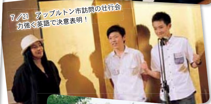
7/21 アップルトン市訪問の壮行会 力強く英語で決意表明！