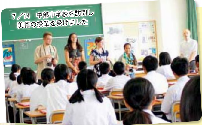
7/14 中部中学校を訪問し 美術の授業を受けました