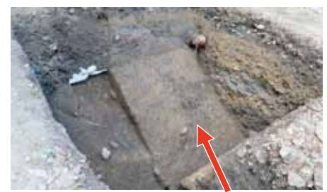
検出された墳丘面