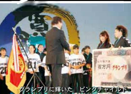
グランプリに輝いた ピンクチャイルド