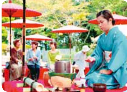
▲萩原寺の野だて茶会