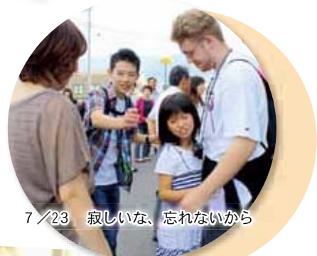
7/23 寂しいな、忘れないから

観音寺市からは中・高校生と引率の3人が7月23日にアップルトン市へ旅立ち、異国での貴重な体験をして8月5日に元気に帰国しました。