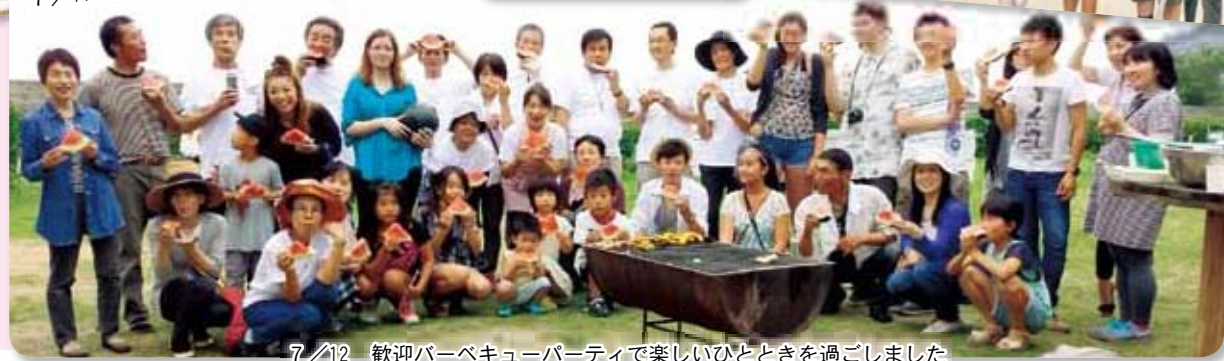
7/12 歓迎バーベキューパーティで楽しいひとときを過ごしました