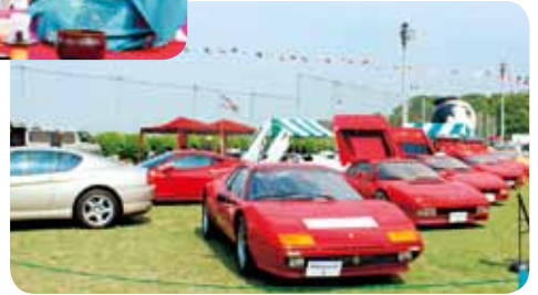
▲世界のスーパーカー大集合