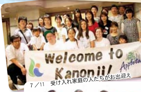
7/11 受け入れ家庭の人たちがお出迎え