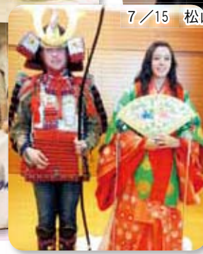
7/15 松山へ日帰り旅行