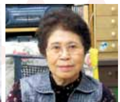
マサ子さん（75） 池之尻町 自分の歯は「28本」