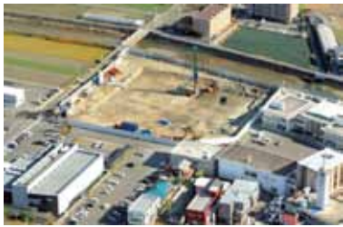
平成25年12月末、上空より撮影