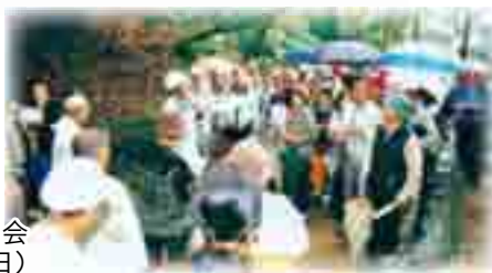
発掘調査現地説明会 (平成23年11月5日)