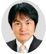
副議長 大平 直昭