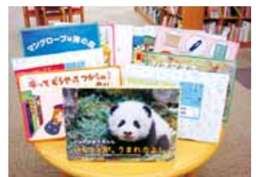
読み聞かせなどに利用してください

中央図書館 ☎ 23-3960 大野原図書館 ☎ 54-5715 豊浜図書館 ☎ 52-1206