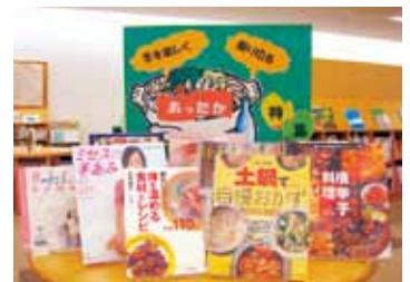
寒さ対策に役立ててください