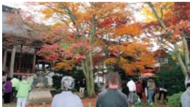
見事なモミジに足を止める

大野原町田野々の法泉寺で「第12回もみじ祭り」があり、時々雨が降るといふ、あいにくの天候でしたが、大勢の市民らが訪れました。訪れた人たちは赤と朱、黄の三色に色分けた「三色もみじ」を鑑賞したり、写真を撮ったり。琴の演奏や野だて、特産品の販売なども楽しんでいました。