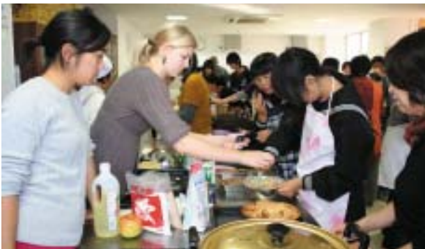
会話も料理も楽しみました

一ノ谷総合コミュニティセンターで観音寺市国際交流協会主催のお国自慢料理大会があり、外国人や市民ら65人が参加しました。作った料理はミャンマー、パキスタン、タイ、ベトナム、アメリカ、ジャマイカ、中国、日本の8カ国、17種類。調理の後、みんなで試食し、感想を話し合ったり、料理法を教え合ったりして楽しく過ごしていました。