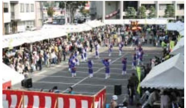
大勢の市民らが参加

福祉センター前駐車場などで「ふくしまつり2009」があり、特設ステージなどで歌や踊りなどが披露されました。市民らは歌に合わせて口ずさんだり、熱演に大きな拍手を送ったり。また、養護学校の生徒らの作品やボランティア団体などの物品を市価より安く買い求めたり、出来たてのうどんやおでん、もちなどを食したりして楽しんでいました。