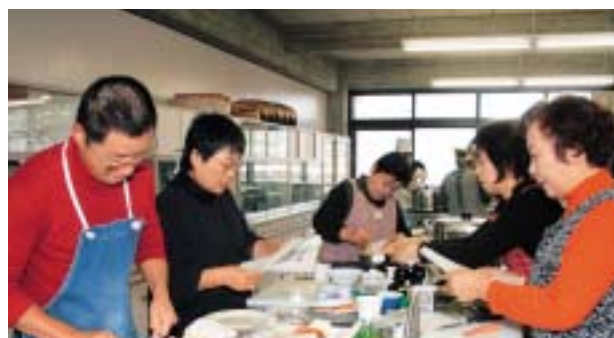
いつもと違うおせち料理に挑戦

地元の魚や地域漁業への関心を深めてもらおうと県立観音寺中央高等学校で料理教室がありました。市民ら約50人が、地元で捕れた魚を使いアナゴピザなど5種類のおせち料理作りに挑戦。5人が1組になり、レシピを見ながら、講師や食物系列の生徒のアドバイスを受けながら、正月らしさを演出した豪華なおせち料理を次々と完成させていました。