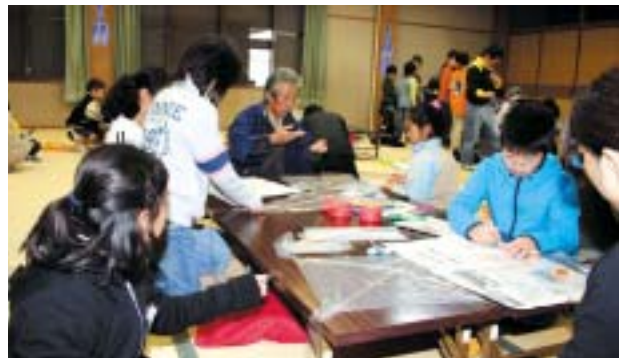
優しく丁寧に教えてくれました

「ちゃれんじキッズスクール・ たこ つくり」が豊浜町南部集会所でありました。市内の小学生46人が仮屋じゃこ倶楽部の人たちの指導で、たこ作りに挑戦。しっぽの長さを調節して高く飛ばす工夫をしたり、お気に入りのアニメなどの絵を描いたりしてオリジナルたこを完成させました。その後、外でたこ揚げを楽しんでいました。