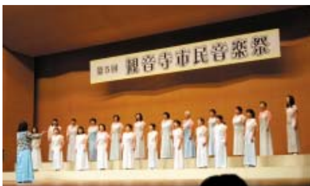
美しいハーモニーに感動

市民会館大ホールで「第5回観音寺市民音楽祭」があり、17団体が参加しました。園児や小・中・高校生、市民らが常日ごろの練習の成果を披露。観客らは懐かしいメロディーに体を揺らしたり、美しいハーモニーに拍手を送ったり。後半には吹奏楽の協演もあり、熱気あふれる演奏に感動の様子でした。