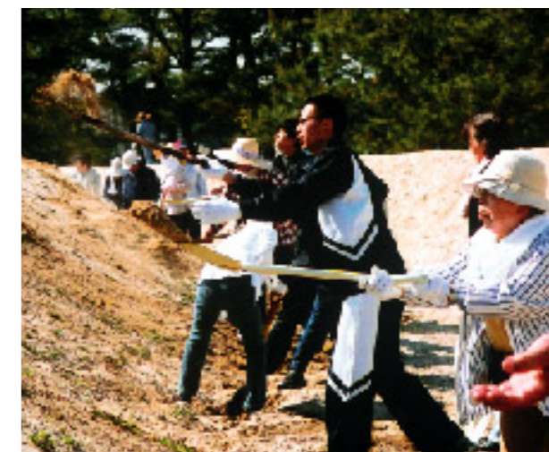
スコップを持つ手に力が入ります

初夏を思わせる陽気の中、春の恒例行事「銭形砂ざらえ」がボランティア約500人が参加して行われました。山頂からの指示によりスコップで砂をかき上げたり、表面をならしたり。強い日差しに汗をふき、休憩を繰り返しながらの作業で「寛永通宝」がきれいに修復されました。参加した皆さんありがとうございました。