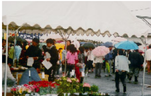
たくさんの人出でにぎわいました

JR豊浜駅前第22回つつじまつりが開催されました。あいにくの雨模様でしたが、フリーマーケットやくじ引き、つきたてのお餅やお寿司の販売などが行われ、子どもからお年よりまで傘を手に次々と訪れていました。豊浜駅構内はつつじが満開で、鮮やかなピンク色が訪れた人たちの目を楽しませていました。