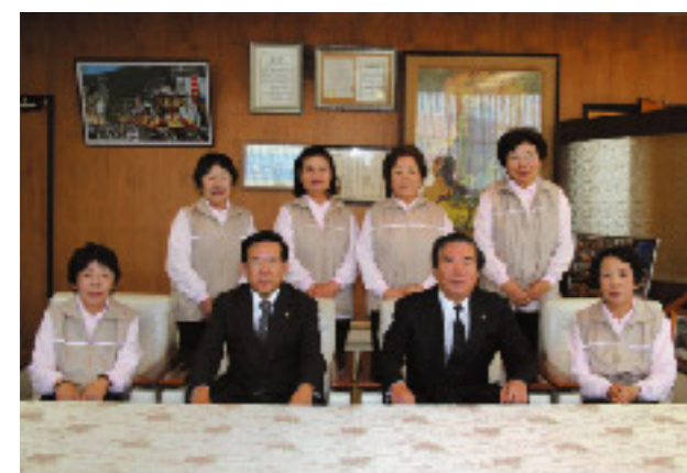
自分の力を出し切ります