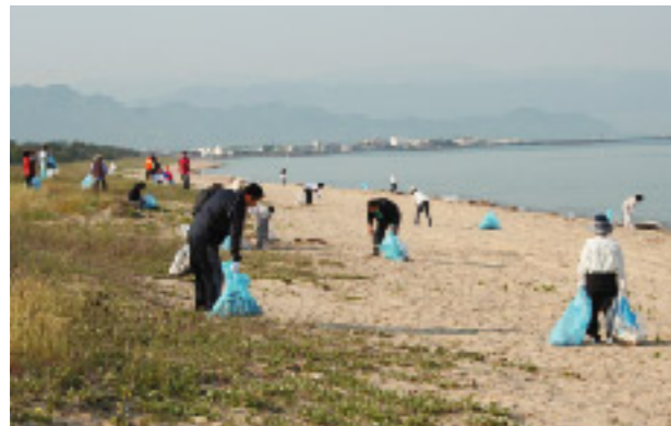
地道な努力はきっと報われる

有明浜でクリーン作戦が行われました。これは、郷土の浜をきれいにしようと平成8年から月1回第2土曜日の早朝に実施されているもので、今回で132回目。「大きなことも小さな一歩から」の精神で毎月清掃を続けてきた甲斐があって、ごみの量も一時より減ってきました。打ち上げられたごみを根気強く集めてきた成果です。協力していただいている皆さんありがとうございます。