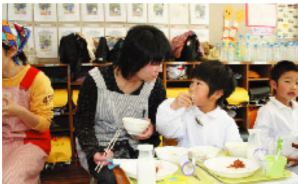
▲楽しく話しながら食べました

豊田小学校で親子給食会が行われました。マグロのじぶ煮や豆ご飯などの給食を親子で準備した後、みんなで食事をしました。大好きなお母さんやお父さんと一緒に給食が食べられるとあって、児童らは大喜び。「見て見て、全部食べたよ」「これおいしいね」などと弾む会話に、こぼれる笑顔。家で食べるのとは、また違った環境で、お友達にも囲まれ、楽しい昼食会になりました。