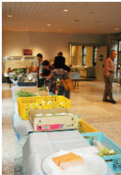
◀商品を手にとって品定め

まで開催(商品が無くなり次第終了)されます。市内で採れた新鮮な野菜や特産品などを販売していますので、ぜひお立ち寄りください。