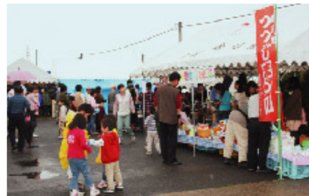
▲毎年、楽しみにしている人でにぎわいました

豊浜駅前広場で、第21回つつじ祭りが行われました。これは、豊浜駅のつつじが咲くころ毎年行われるもの。ことは、あいにくの雨でしたが、青空市や棉の種の販売、手作り品の販売やフリーマーケットなどが開催され、多くの人でにぎわっていました。中でも杵と臼でついた、つきたてのお餅には長蛇の列ができ、お餅が出来上がるたびに、飛ぶように売っていました。訪れた人たちは、つつじを愛でながらゴールデンウィークの最終日を十分満喫していました。