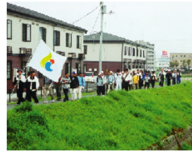
▲元気に出発しました

市民会館前から琴平町の高灯ろうを目指して歩く「2006こんぴら健脚大会」が行われ、親子連れや友人同士ら約80人が参加しました。全長約22キロメートルの道中、道端の春の草花や菜の花を愛でたり、会話を楽しんだり。首にかけたタオルなどで額の汗をぬぐいながら、参加者それぞれがマイペースで歩いていました。