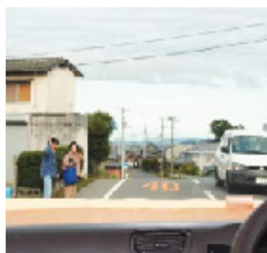
自由乗降禁止区間以外どこでも止まります

これからも「のりあいバス」の運行によって、高齢者たちの移動手段を確保し、外出の機会を増やしたり、地域におけるコミュニティを充実させたりしていきます。 また高齢者だけでなく、車を使えない、または車を使いにくい市民に対しての市民サービスや日常生活の利便性を向上させるとともに、経済や文化の活性化に貢献し、市民のみなさんに愛される「のりあいバス」を目指します。