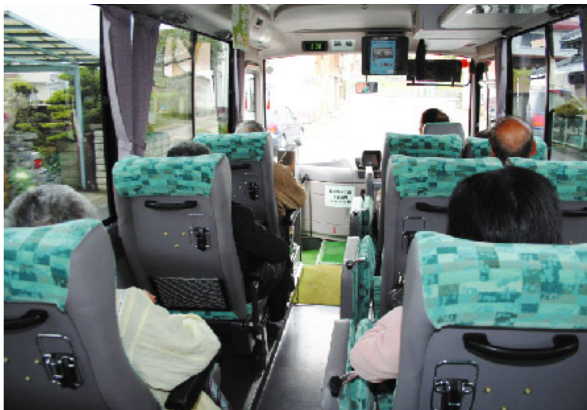
多くの市民が生活の足として利用しています