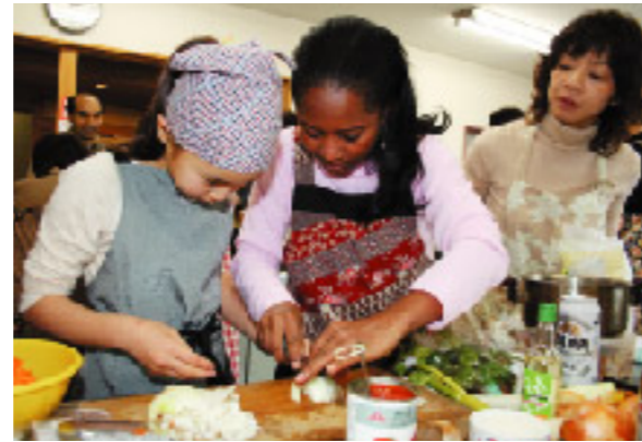
作り方を教わりました

高室公民館で観音寺市国際交流協会主催のお国自慢料理大会が開かれました。市内に在住する外国人や協会の会員のほか、高室小学校の児童や保護者ら約60人が参加。参加国はアルバニアやブラジルなど7カ国。肉だんごのスープやバナナブレッド、チキン・テトラジーニなどの料理を次々と仕上げ、参加者全員で味わいました。「いろんな国の人たちと知り合いになれて楽しかった」「食べたことのない料理が味わえました」などと参加者たちは交流に満足していました。