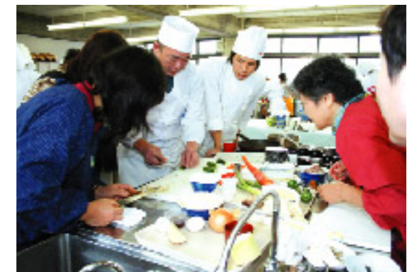
お正月らしく、キュウリで松飾り

観音寺中央高等学校で三豊郡漁業組合連合会主催のお魚料理教室が開かれ、講師の石川先生指導のもと、いわしのコロケやぶりのカルパッチョなどの変わりお節料理を作りました。ニンジンやダイコン、キュウリやゴボウなどでお正月用に飾りつけたお節に、50人の参加者は興味津々。試食では、新しい感覚の料理と新鮮な魚に舌鼓を打っていました。