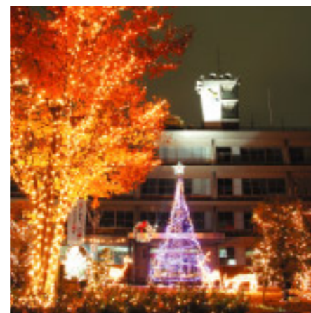
光のコントラストが絶妙です

市本庁舎前にイルミネーションが点灯しました。ことしのメインはオレンジ色や緑色の電飾で飾られたリースを背にし、雪の結晶を頂に携えた6メートルにもおよぶツリー。そのほか、バンビやトナカイ、フラミンゴなども出迎えてくれます。点灯期間は1月8日まで、点灯時間は午後5時から午後10時までです。澄みきった空気の中にそびえ立つツリーやその仲間たちにぜひ会いに来てください。