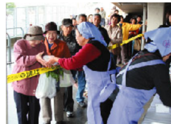
おいしいそうな料理に、思わず笑顔がこぼれます