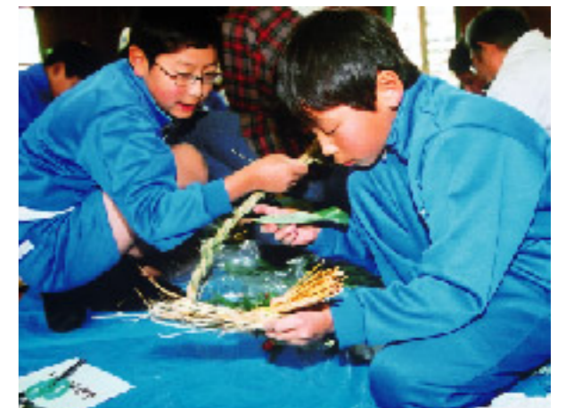
しめなわ作りはまかせて!

豊浜小学校の6年生76人がしめなわを作りました。これは観音寺市女性団体連合会が主催し、長寿会の指導で行われました。しめなわは、わらの根元部分を束ね、それを半分ずつに分けてより合わせて縄を作り、輪にしてウラジロなどの飾りを付けて完成。児童たちは、長寿会の皆さんの手を借りたり、何度もやり直したり、手を湿らせながらわらと悪戦苦闘。それでも、時間とともにわらの扱いに慣れてきて、出来上がったしめなわを友だちと見せ合ったり、さらに2つ目に挑戦したりしていました。