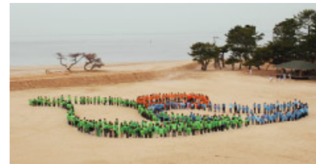
観音寺市のイニシャル「K」をかたどっています

有明グラウンドでみとよ青年会議所主催の「市章を描こう」イベントが行われました。新市の市章を描いて合併を祝おうと約600人の親子連れらが参加。太陽の温かさを表したオレンジ、緑の生育を表した黄緑、水の流れを表した青、それぞれが色鮮やかに人文字で表現されました。グラウンドに大きく描かれた市章は、空から撮影されました。