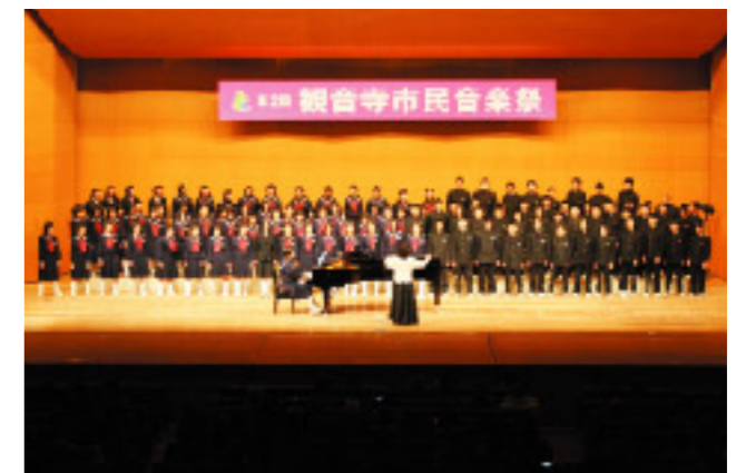
会場が温かなメロデーに包まれました

市民会館大ホールで、第2回市民音楽祭が開催されました。坂出高等学校合唱部のゲストを含め、大野原小学校マーチングバンドや中部中学校吹奏楽部など、合唱や合奏の好きな15団体が出演。各団体がこの日のために練習してきた成果に、観客から大きな拍手が送られていました。プログラム最後の「Believe(ビリーブ)」や「ふるさと」の合同演奏では、出演者と観客の心が一つに、一体感のある演奏会になりました。