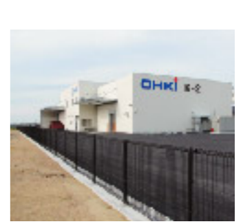
山田産業団地 大紀商事(株) 観音寺第2工場完成

◆1月の納税・納付◆ 市・県民税(4期) 国民健康保険税(4期) 介護保険料(4期) 納付期限 1月31日(水) 納め忘れのないよう、便利な口座振替をぜひご利用ください。