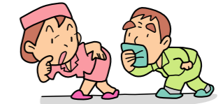
災害弱者……高齢者・障がい者・病人など、災害時の非難や非難所生活で、周りの人の助けが必要な人

皆さんは、地域や家庭で、災害時の対策について話し合っていますか。女性も男性も交えて、両方の視点から話し合うことが、被害を最小限にとどめる第一歩です。