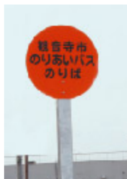
「のりあいバス」停留所