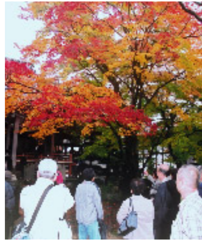
黄、赤、朱色のみことな葉に感嘆

「三色もみじ」で有名な大野原町の法泉寺で「もみじ祭り」が開かれました。訪れた見物客は琴の優雅な音色を聞きながら、雨にぬれて鮮やかさを増した紅葉を楽しみ、深まる秋を感じていました。境内では、もみじの葉を拾う人や「三色もみじ」をバックに記念撮影をする家族連れらの姿が見られました。また、地元野菜やまんじゅう、うどんなどの販売のほか、絵手紙の展示などがあり、にぎわっていました。