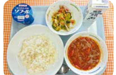
〈献立〉大野原学校給食センター