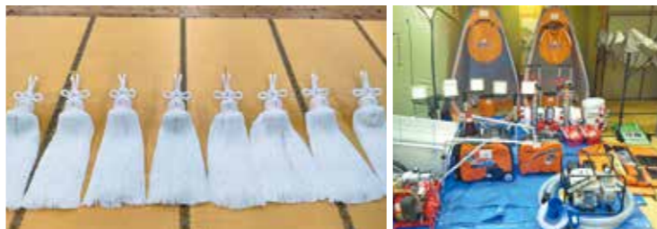
東村自治会 辻東自主防災会