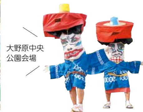
大野原中央公園会場

大野原中央公園と萩原寺で萩まつりが開催されました。萩原寺会場では野点茶会のほか、観音寺総合高校と笠田高校の書道部と華道部の生徒が、歌や琴の調べに合わせて実演。4年ぶりの開催となった大野原中央公園会場は多彩なステージイベントと地元団体や企業が出店した青空市で盛り上がりました。