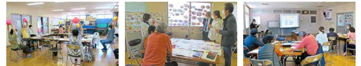
理学療法士による体操講座

半年間の全3回コースで、仲間と一緒に楽しく健康のためにできることを探しましょう。