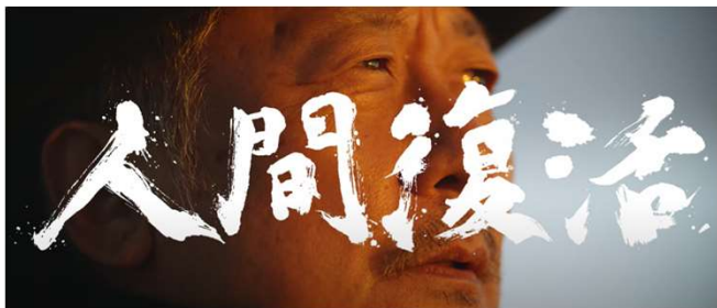
ブランデッドムービー「人間復活」170秒