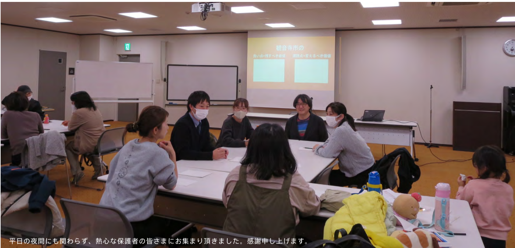
平日の夜間にも関わらず、熱心な保護者の皆さまにお集まり頂きました。感謝申し上げます。

香川県観音寺市は交通アクセスに恵まれた立地を活かして、中四国最大級の新しい道の駅「かんおんじ」（仮称・以下、道の駅）を計画しています。現在は、ちようさ会館（豊浜町）付近を建設候補地として基本構想をとりまとめ、具体的な検討を進めています。 道の駅に市民から大きな期待が寄せられる一方で、様々な意見があることも事実です。人口減少と少子高齢化が急速に進むなかで、いちばん大事なことは「これからますます観音寺市に住み続けたい」ことに尽きます。限られた資源・人材・財源で、未来を拓くには、官と民の連携が欠かせません。そもそも行政は商売が得意ではなく、出来ることにも限界があります。道の駅では市民の積極的な参加、とくに「自分ごと化」が不可欠です。そこで、市民が道の駅に対して本当に望んでいるコトやモノはなにか？直接教えていただき、ワークショップを子育て中の保護者を対象に実施しました。