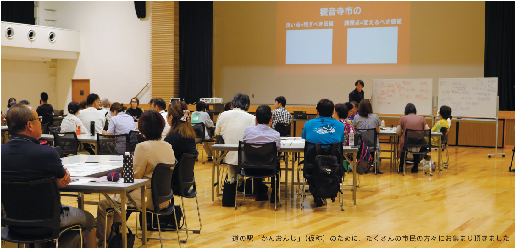
道の駅「かんおんじ」（仮称）のために、たくさんの市民の方々にお集まり頂きました

開催日：令和5年（2023年）9月30日 土曜日 発行元：観音寺市 政策部プロジェクト推進課