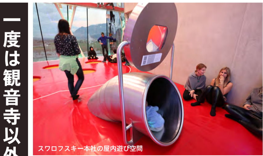
スワロフスキー本社の屋内遊び空間

一度は観音寺以外の地域で学ぶことも大事 香川県立観音寺総合高校の皆さま、このたびはありがとうございました。高校生の皆さまが、観音寺市よりも大きな都市に憧れ、近所には存在しない店舗や機能に憧れるのは当然のことだと思えます。一度は観音寺市以外の地域で学び、働くことも刺激になるでしょう。しかし一番大事なのは、自分たちの生まれ故郷を、自分たちで創造し、観音寺市にしかない価値を創り続け、ずっと観音寺市に住み続けたいと思えるか？に尽きます。高校生の皆さまが働き盛りになる頃、新しい道の駅は完成しています。あなたがあなたらしく、家族や愛する人と共に、観音寺市を愛し、人生を楽しみながら、新しい時代の官民連携の一翼を担うことを期待しています。 【ファシリテーション・本紙構成 川西 康之】