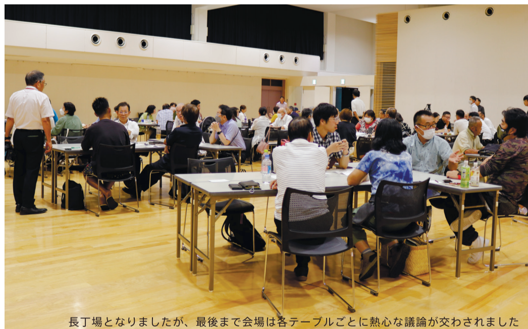
長丁場となりましたが、最後まで会場は各テーブルごとに熱心な議論が交わされました

市民の熱意に感謝 たくさんのご参加、進行へのご協力ありがとうございました。貴重なご意見をたくさん頂きました。人口減少時代、行政だけでなく地域の未来は担えませぬ。熱心な市民の皆さまのご協力が不可欠であり、いちばん大事な「市民の熱意」「街の未来への思い」という大事な基礎は既に醸成されていると感じました。今後も楽しみます。 【ファシリテーション・本紙構成 川西康之】