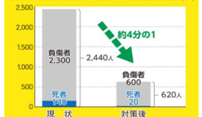
家具類の転倒・落下防止対策による死傷者の軽減(人)

県の南海トラフ地震被害想定では、家具類の転倒・落下防止対策を行うことで、 死傷者数を4分の1に軽減 できると想定されています。