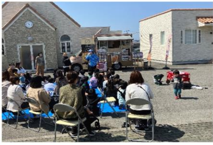
【知育ヨガ教室の様子】