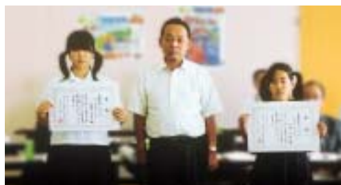
第17回合併協議会 新しい『観音寺市』誕生ポスター 最優秀賞受賞者表彰