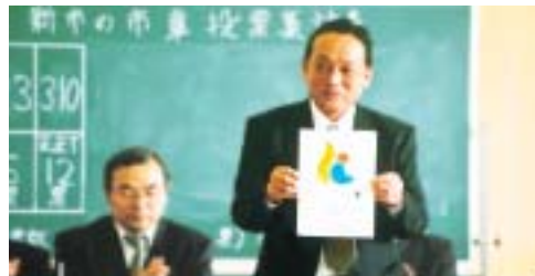
第13回合併協議会 新しい『観音寺市』の市章を選定

第18回合併協議会 職務代理者選定 平成17年10月1日 新市ガイドブック配布 平成17年10月1日 最後の合併協議会だより発行