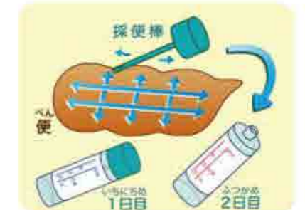
資料提供: NPO法人プレイブサークル運営委員会

観音寺市の大腸がんの検診受診率は、8.3%と低い状況です。 40歳を過ぎたら、年に1回、大腸がん検診を受けましょう。