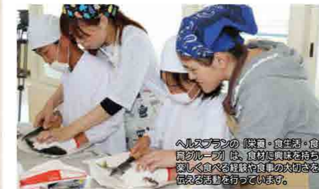
ヘルスプランの「健康・食生活・食育グループ」は、食材に興味を持ち楽しく食べる経験や食事の大切さを伝える活動を行っています。

高室小学校5年生の親子19組が三豊郡漁業組合連合会と市食生活改善推進協議会の協力で魚を使った調理実習を行いました。これは市のヘルスプランの活動の一つで、児童たちは慣れない手つきながらも保護者の手助けを受けアジをさばき、ムニエルなど4品を作りました。「命の大切さがよく理解できた」と児童の感想もあり、親子で食事の大切さを学習しました。