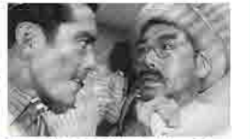
酔いどれ天使 午前10時～

日時 8月6日(日) 場所 小ホール 料金 1作品ごと500円 (全席自由) ※入替制