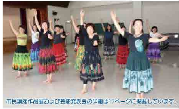
市民講座作品展および芸能発表会の詳細は17ページに掲載しています。

毎週木曜日、共同福祉施設で市民講座「楽しいハワイアンフラ」が行われています。15人の講座生は、8月の芸能発表会に向けて「南国の夜」を練習中。初心者ですが、講座が終了するまでには十分楽しんで踊れるようになるそうです。手の動きで花や風を表現しながら足のステップを組み合わせて、流れるような動作の踊り手たちは、笑顔で溢れていました。