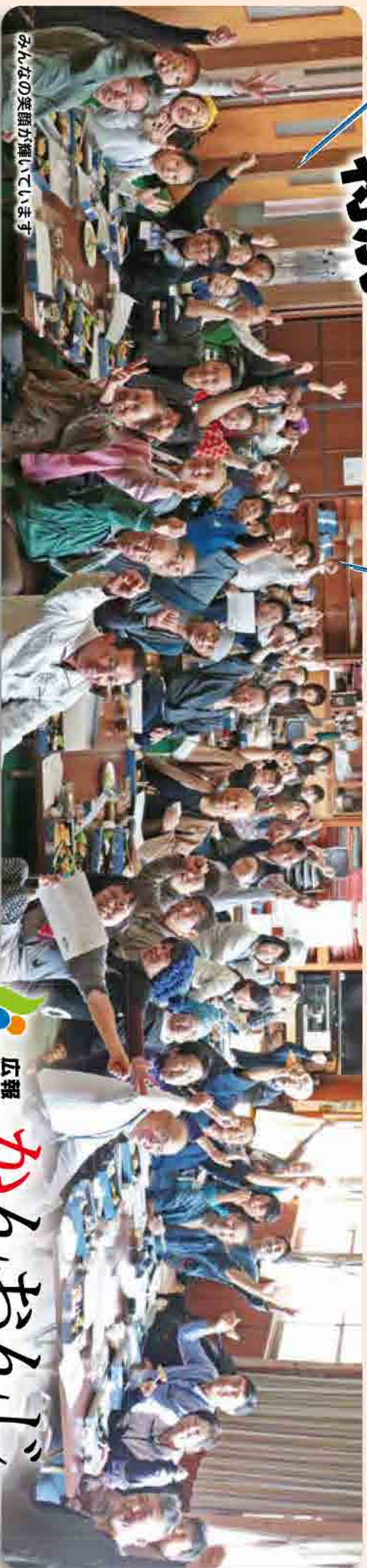
みんなの笑顔が輝いています