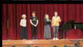
10月16日～20日 市内の小・中学校で、はぐみコンサート