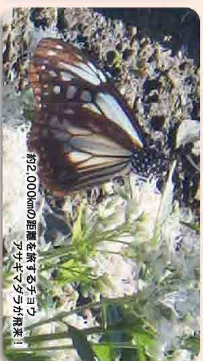
約2,000kmの距離を旅するチヨウ アサギマダラが飛来!