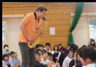
10月16日～20日 市内の小・中学校で、はぐみコンサート