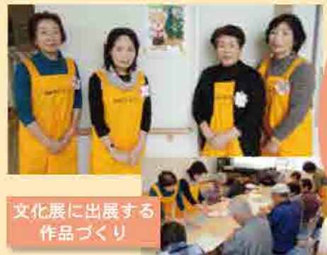
文化展に出展する作品づくり

日時 毎月第3水曜日 (変更する場合があります) 午前9時30分～午前11時 (受付 午前9時～) 場所 大野原いきいきセンター1階 参加費 100円