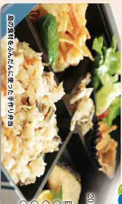
島の食材をふんだんに使った手作り弁当