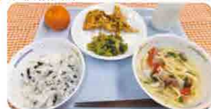
〈献立〉大野原学校給食センター ★ワカメごはん ★打ち込み汁 ★エビジャコのかき揚げ ★食べて菜のあえ物 ★ミカン ★牛乳

簡単に作れて、野菜不足解消にもピッタリ。しかも、おいしくて、食べると体の芯からポカポカしてくる打ち込みうどんを、家族一緒に食べて心も体も温まりましょう。