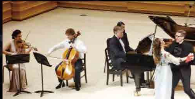
10月22日 ハイスタッフホール大ホール The Final Concert ～9人のアーティストによる華麗なる共演～