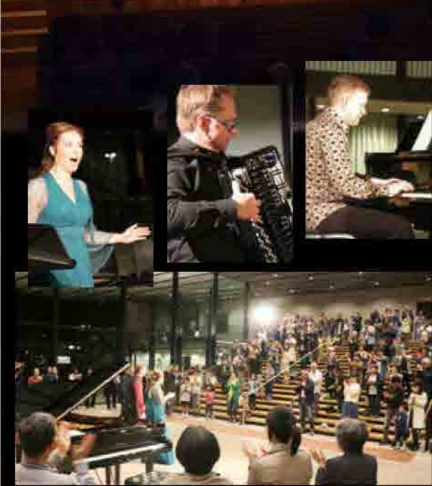
10月18日 ロビーコンサート