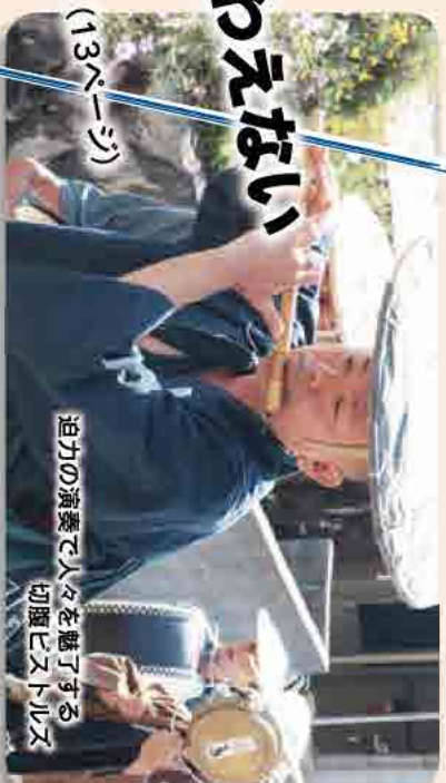
迫力の演奏で人々を魅了する 初雁ビストルズ