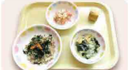
(献立)観音寺保育所・幼稚園 ★キッズビビンバ ★中華スープ ★キャベツのツナサラダ ★バナナ