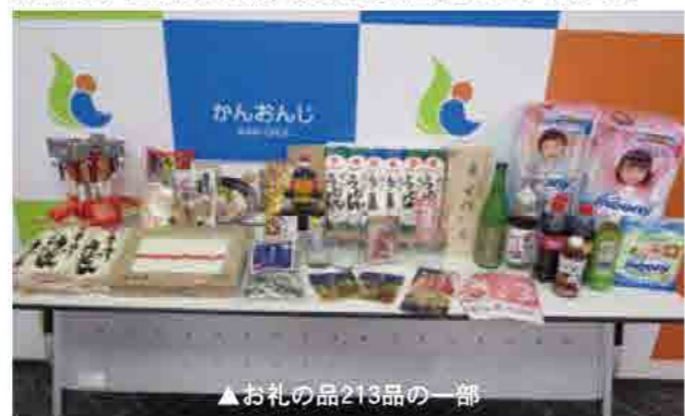
▲お礼の品213品の一部

本市では、インターネット経由の寄附をポータルサイト「ふるさとチョイス」で受付しています。このほど市外の皆さんから一層の応援をいただくために、8月1日から「楽天」、9月10日から「さとふる」のサイトでも寄附受付を開始しました。さらに、寄附いただいた人へのお礼の品を拡充させ、観音寺の野菜や果物等、魅力ある特産品を随時追加していきます。