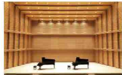
ハイスタッフホール大ホール

ハイスタッフホール 〒768-0060 観音寺市観音寺町甲11-86番地2 ●コンサート 時 3月3日(日) 午前の部 午前10時～正午 午後の部 午後1時～午後5時 *時間は変更する場合があります *演奏時間は一人(組)8分以内 *ソロまたは連弾 所 ハイスタッフホール 大ホール 料 無料 問 ハイスタッフホール ☎2313939 文化振興課文化芸術係 ☎2313943