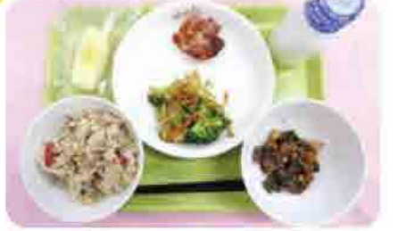
〈献立〉観音寺学校給食センター ☆いりこめし ☆鶏肉の香味焼き ☆ブロッコリーのあえもの ☆まごはやさしい煮 ☆牛乳 ☆りんご

伊吹いりこを使った郷土料理いりこめし 瀬戸内海ではイリコ漁が盛んで、特に伊吹島の沖合で捕れる「伊吹いりこ」は、安全で高品質とされ全国的に有名です。また、観音寺ブランド認証品にもなっています。そのイリコと季節の野菜と一緒に炊き込んだ「いりこめし」は、県内各地で特色ある家庭料理の一つとして伝えられてきましたが、近ごろ家庭の食卓に上る機会は少なくなってきました。地元で捕れたイリコを使った郷土料理を家庭でも作ってみてください。 ※給食では、かえり(小煮干し)を使用しています。