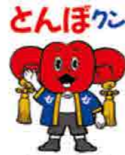
ちょうさ会館 マスコットキャラクター

年中お祭り気分が味わえるちょうさ会館を無料で開放します。初めて太鼓に触れる人も大歓迎の和太鼓演奏ワークショップや、ちょうさのどんぼづくり体験など、ちょうさが大好きになるイベントを開催します。