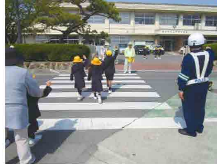
(上) 常磐小学校の交通安全教室の様子。地域住民による「イエロー隊」が子どもたちを見守ります。

作り方 ① サケに塩を振り、しばらく置く。出てきた水分をペーパーなどで軽く押さえながら拭き取る。 ② パン粉にみじん切りにしたパセリを混ぜる。 ③ ①に小麦粉・卵・②をつけて180度の油で揚げる。