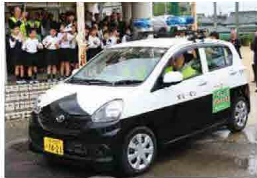
市内9小学校区で巡回している青色防犯パトロール車。登下校時や土日に住民の皆さんがボランティアで見守り活動を実施しています。