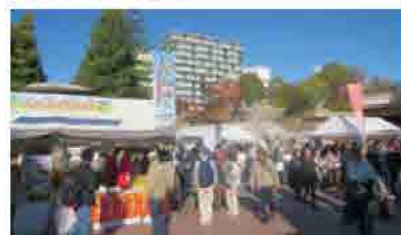
尼崎中央公園で開催したPRイベント