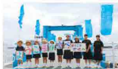
ことし開催された瀬戸内国際芸術祭