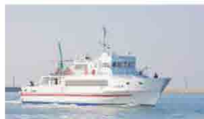
「ニューいぶき」に代わる新船を建造中