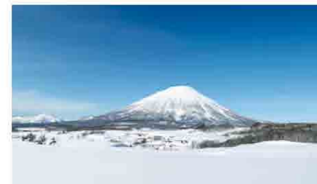
日本百名山の一つ「羊蹄山(ようていざん)」