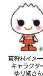
真狩村イメージキャラクター ゆり姉さん