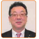
豊浦孝幸 自民新国会