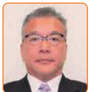
伊丹 準二 自民新国会