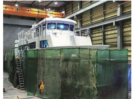
▲建造中のNEW IBUKI II