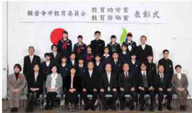
教育功労賞：6人 教育奨励賞：一般5人、小学生12人、中学生5人、 大野原小学校マーチングバンド 他の模範となる児童や生徒のほか、長年にわたり学校保健や学校教育、青少年健全育成などの分野で貢献された方々に教育委員会より表彰状を贈り、功績をたたえました。