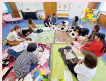
タッチケア&わらべうた