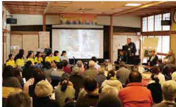
ミュージカルは3月15日(日)開催。詳しくは23ページへ

ミュージカル「夢つむぎの詩」の舞台モデルになった、五郷地区の魅力を紹介するイベント「夢の里 五郷」を五郷活性化センターで開催し、104人が参加しました。旧五郷小学校海老濱分校の卒業生などが学校生活の思い出や当時の生活について語り、ミュージカルに出演する小・中学生と交流しました。