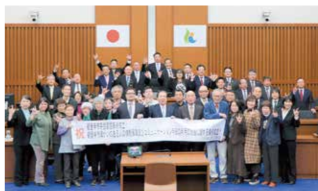
3月25日、市議会で2つの条例が議決されました

手話は日本語や英語など同等の言語ですが、それがなかなか浸透しませんでした。今回、手話言語条例とコミュニケーション条例を別々に制定し、手話とは意義があると思っています。私は、生まれつき聴覚に障がいがあります。私が子どものころ、ろう学校では手話が禁止されており、聞こえる人の口の動きを読み取り、自分の口で話す「口話」を厳しく教えられました。ろう学校では口話が上手だったものの、いざ社会に出てみると、「えっ？」と聞き返されたり、「外国から来たの？」と言われたりして、壁を感じました。家族の会話にも入っていき、家庭でも孤立していました。聞こえない人にとって一番の問題は、情報格差です。情報は、周囲の会話などから自然と