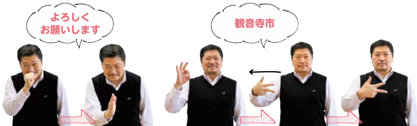
よろしく お願いします 鼻の前でこぶしを握り、手を開いてお辞儀する。