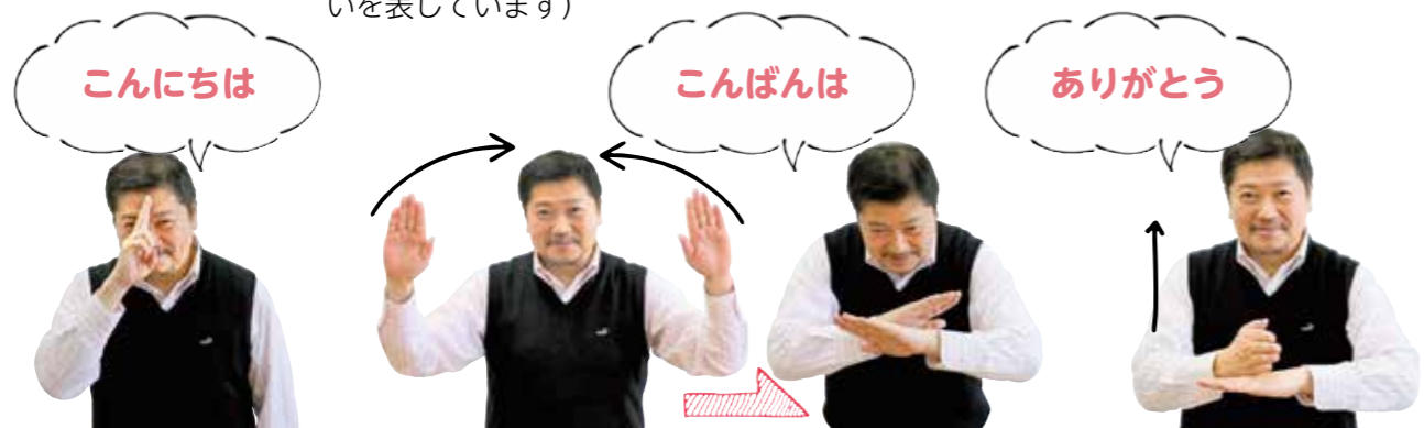
こんにちは 指2本を、おでこにつけたままお辞儀する。(時計の正午の針を表しています)