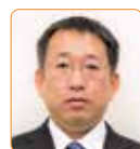
白川 雅仁 公明党