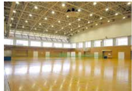
▲すぽっシュ豊浜 メインアリーナ