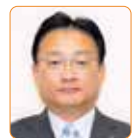
石山 秀和 公明党