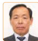
茂 託問 自民新政法