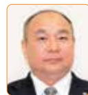
井下尊義 自民新国会