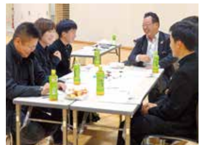
▲令和元年市民との意見交換会の様子