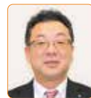
豊浦孝幸 自民新国会