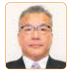
伊丹 準二 自民新国会