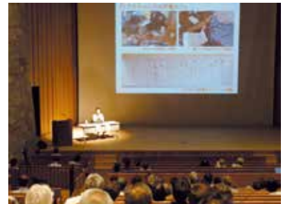
▲令和元年市民フォーラムの様子

広聴広報委員会では、この機会に市民フォーラムおよび市民との意見交換会の在り方を再検討し、令和3年の開催に向けて、市民の皆さまとより広く意見を交換できる場を設けられるように協議してまいりますので、今後ともご指導のほどよろしくお願い申し上げます。