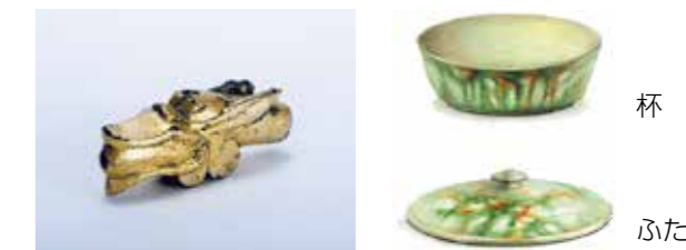
出土した竜頭(左)、奈良三彩の復元図(右)