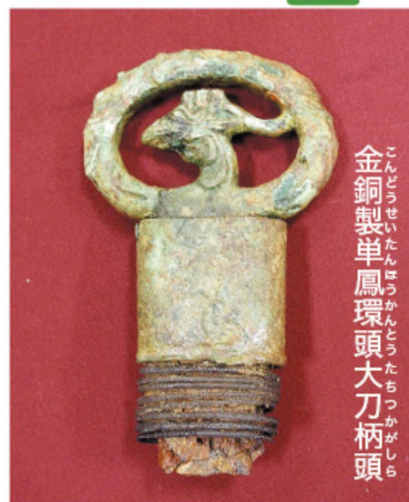
金銅製単鳳環頭大刀柄頭