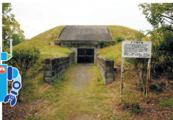
現在のかんす塚古墳