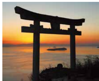
夕暮れ時には、伊吹島が鳥居の中に浮かんでいるような幻想的な風景を見ることができます

開運スポットとして人気 標高404メートルの稲積山の頂上に本宮がある高屋神社（稲積神社）。讃岐国延喜式内二十四社の1社です。本宮の鳥居は「天空の鳥居」と呼ばれ、開運・絶景スポットとして多くの観光客が訪れています。 山頂からは市街地が一望でき、天気が良ければ石鎚山まで見ることが出来ます。また、朝、昼、夕方、夜と時間ごとに景色が移り変わる魅力があります。 下宮から登山すると、最後に270段の石段を登りますが、近年老朽化が心配されています。現在、神社の氏子により、石段が修理されています。