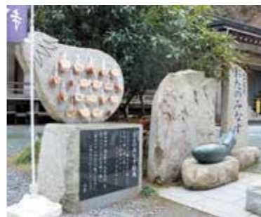
四国霊場第66番札所雲辺寺境内 には縁起物であるナスをかたど った「おたのみなす」という願 掛け石があります