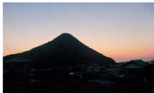
室本町集落側や天空の鳥居がある稲積山山頂から美しい円すい形に見えます

香川県には、円すい形をしたおむすびのような山が多いといわれます。中でも、西から江甫草山（有明富士）、爺神山（高瀬富士）、飯野山（讃岐富士）、堤山（羽床富士）、高鉢山（綾上富士）、六ツ目山（御厨富士）、白山（東讃富士）は讃岐七富士として親しまれてきました。 江甫草山は、九十九山とも書き、願いが九十九かなうという言い伝えがあるそうです。 戦国時代、山頂には九十九（江甫草）城があり、石墨などが残っています。