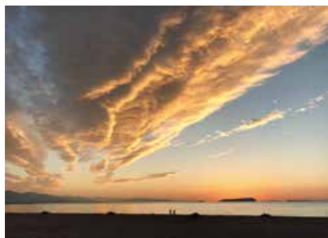
有明浜から見る景色は、季節や天候ごとに 全く別の表情を見せます

元旦の「初日の出」は縁起が 良いとされていますが、ぜひ「初 日の入り」も見て、一年の無事 を願い、新年の誓いを立ててみ てはいかがでしょうか。日は沈 むと必ず昇ります。2021年 が穏やかな一年になるよう、夕 陽に願いを込めて。